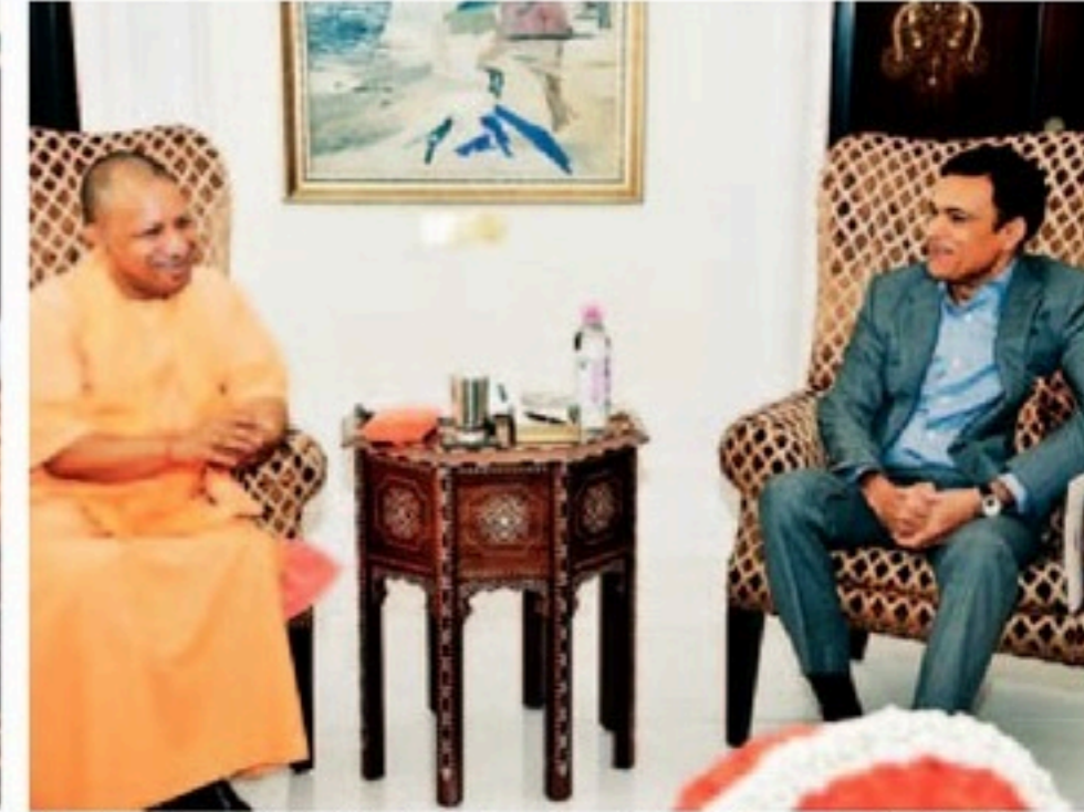
मुंबई में गुरुवार को उत्तरप्रदेश के मुख्यमंत्री योगी आदित्यनाथ से मुलाकात करते (बाएं से) रिलायंस इंडस्ट्रीज के सीएमडी मुकेश अंबानी, आदित्य बिड़ला ग्रुप के चेयरमैन कुमार मंगलम बिड़ला एवं जेएसडब्ल्यू ग्रुप के एमडी सज्जन जिंदल.

मुंबई: उत्तर प्रदेश ग्लोबल इन्वेस्टर्स समित के लिए भारतीय उद्योग जगत को आमंत्रित करने देश की आर्थिक राजधानी मुंबई आए मुख्यमंत्री योगी आदित्यनाथ, यहां से 5 लाख करोड़ रुपये से अधिक के निवेश प्रस्तावों के साथ अपने प्रदेश लौटे हैं.